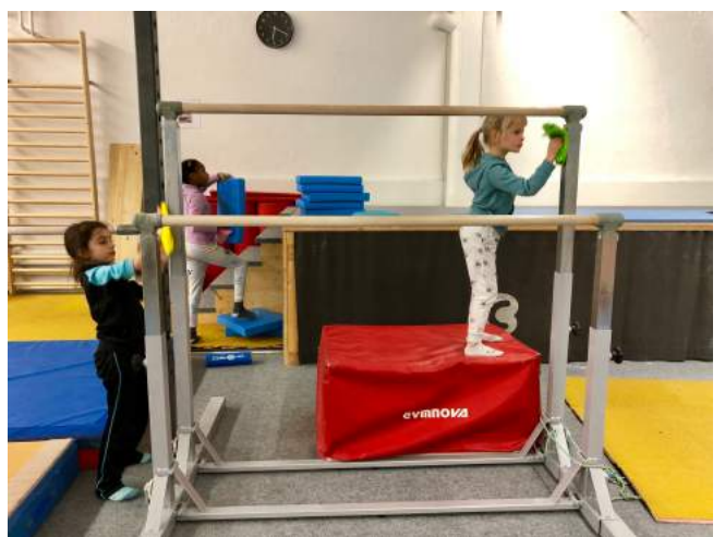
Der „Schrubb-Club“ übersieht kein Detail