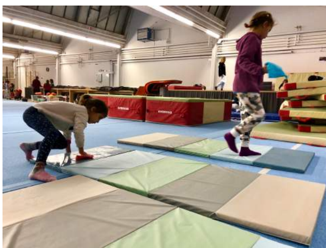
Das Team „Schrubi-Lumpe“ bei der Arbeit