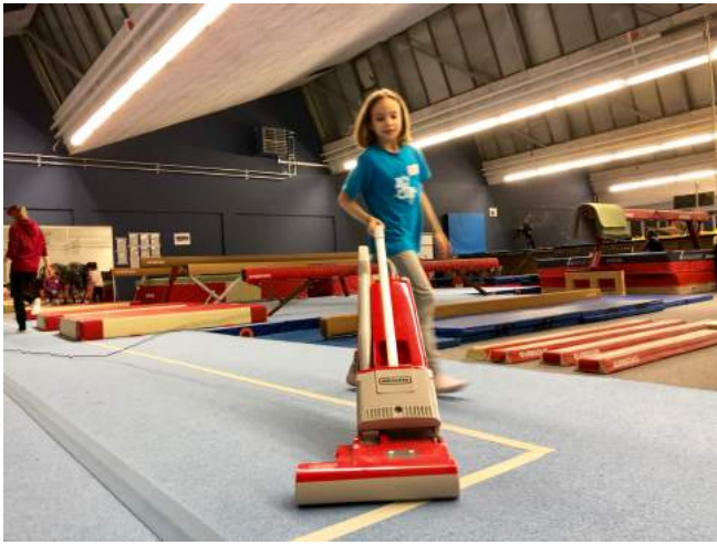
Es wird gesaugt...