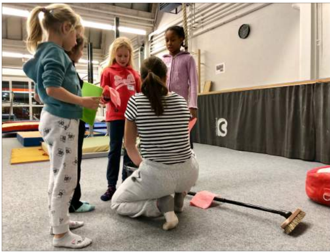
Der „Schrubb-Club“ bei der Einführung