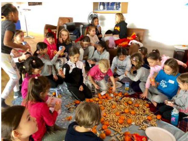
Die Kunstturnerinnen lassen es sich schmecken