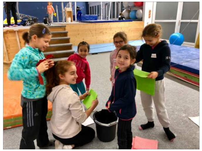
Die „Schrubbis“ mit viel Spass bei der Sache