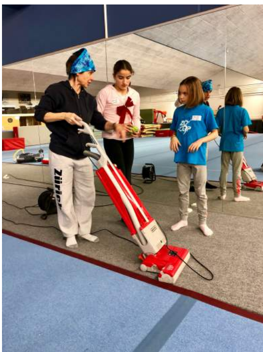
Die Putzchefin erklärt den Sauger