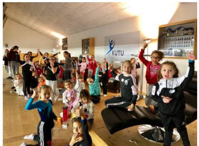
Bis zum nächsten Jahr!