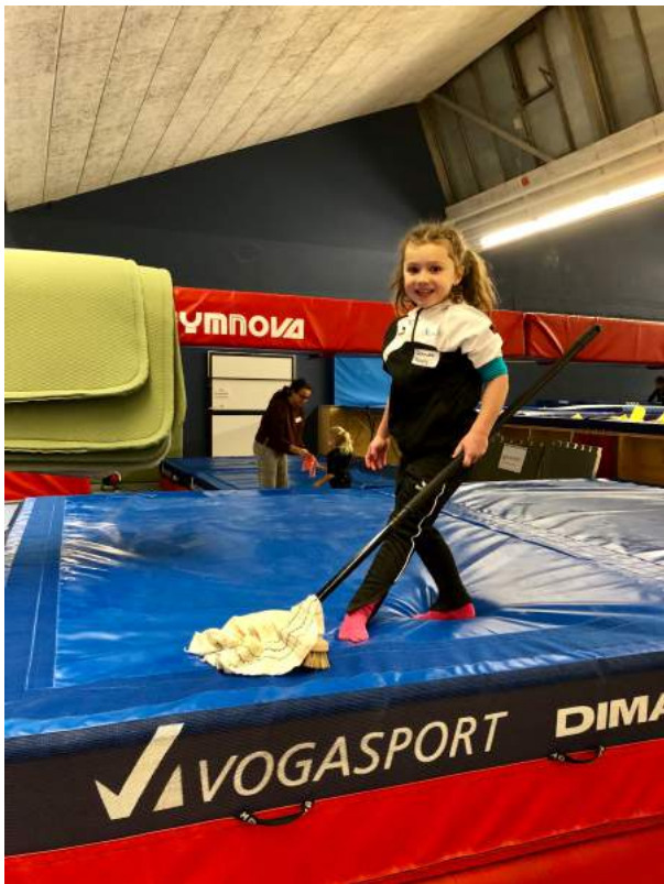
Auch die Jüngsten beweisen ihr Talent