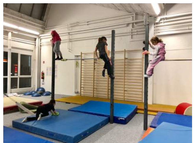
Voller Einsatz der Turnerinnen!