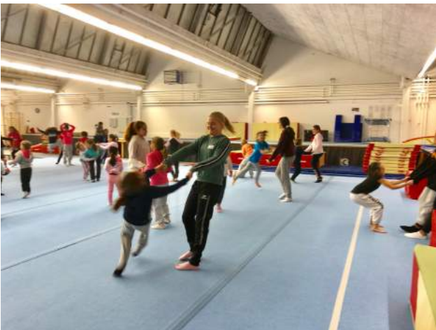
Gross und Klein am Tanzen