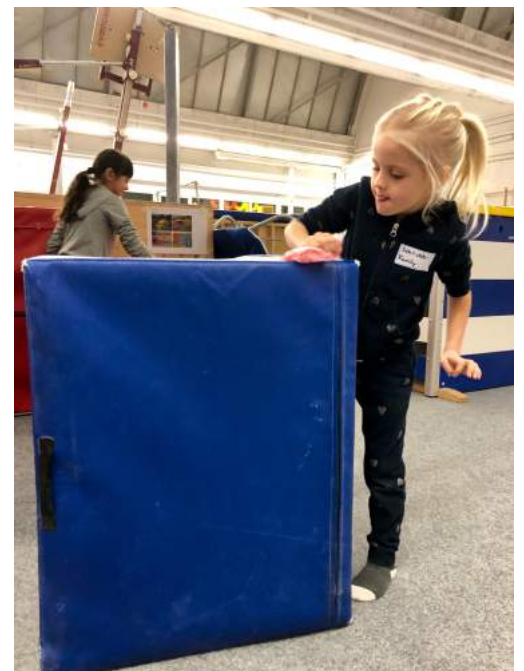
... und dabei sehr genau hingeschaut!