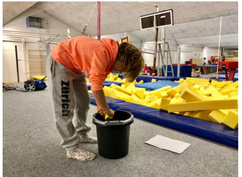
Es kann losgehen: Die Putzlumpen werden nass gemacht