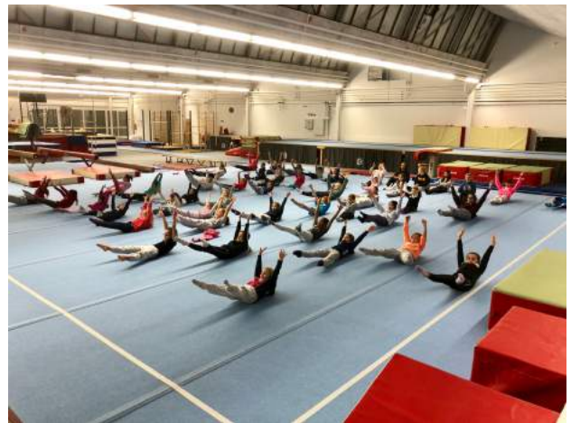
Ganz ohne Turnen halten sie es dann doch nicht aus...